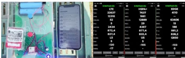
Fig. 2. Pruebas realizadas en campo para validar el envío de mensajes de texto

En el proceso evaluativo, se llevaron a cabo 44 pruebas de campo en diversas ubicaciones y condiciones intrínsecas de la zona, con el objetivo de analizar el desempeño del dispositivo (Ver Figura 2).