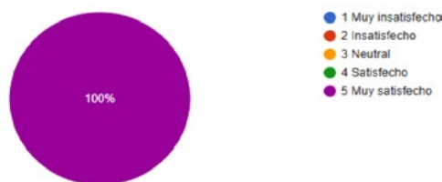
Fig. 4. Satisfacción de los usuarios

La mayoría manifestó que sí lo recomendaría a otras personas, siendo este un resultado de gran peso en comunidades rurales, donde las recomendaciones personales son clave para la adopción de nuevas herramientas, demostrando una señal clara de confianza y utilidad percibida, como se muestra en Figura 5.