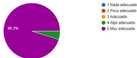
Fig. 5. Reconocimiento de la facilidad de uso

Los participantes consideraron que las instrucciones eran muy claras, reflejando que la forma en la que se explicó el funcionamiento fue efectiva para personas con bajo nivel educativo y sin experiencia previa con este tipo de tecnología, debido a que las instrucciones fueron impartidas de forma oral e ilustrativa sin el uso de lectura de folletos teniendo en cuenta que los encuestados podían ser analfabetas.