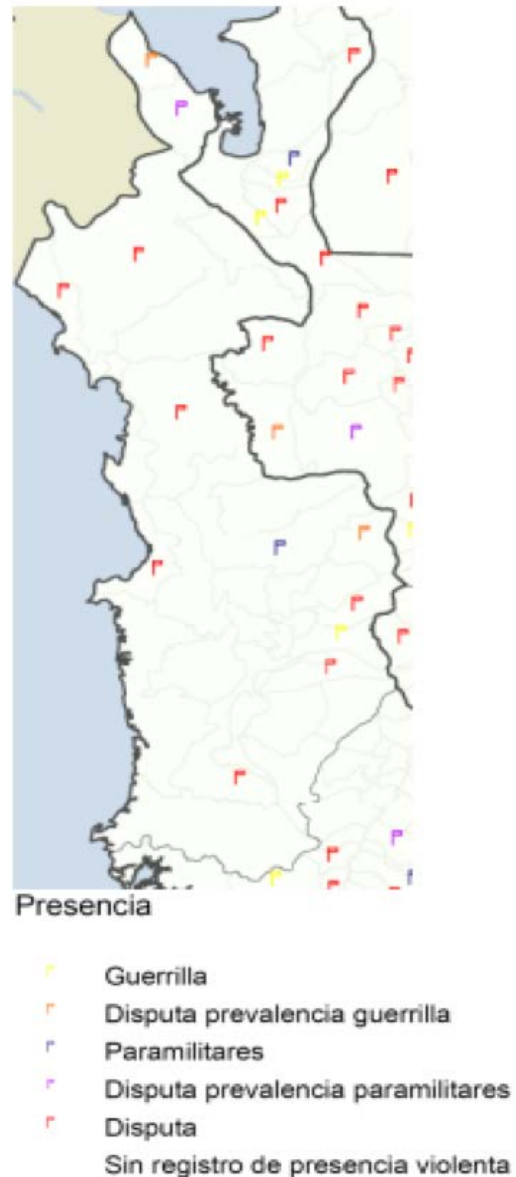
Figura 1. Presencia conflicto Chocó 1997-2001

La presencia de grupos armados al margen de la Ley y la búsqueda de la recuperación del territorio por parte del Estado han ocasionado que el Chocó tenga un gran número de civiles víctimas del conflicto armado, situación que agudiza la brecha social de esta comunidad con respecto al resto del país, viéndose enfrentado a constantes luchas por el territorio, generando un número significativo de desplazamientos forzados que ocasionan la pérdida cultural y de identidad significativa. En la figura 1 se muestra la presencia de estos grupos en el departamento.