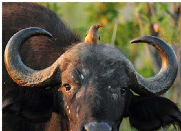
Figura 5: Relación simbiótica de pica bueyes y búfalo del cabo

El pica buey y el búfalo del cabo se benefician mutuamente debido a que el ave se alimenta de los parásitos como piojos o garrapatas que tiene el búfalo en su lomo y este a su vez protege al ave de posibles atacantes; la relación que tienen es de servicio-recurso. En este caso se relaciona con los partidos de la Alianza Verde y Opción Ciudadana en el que uno se beneficia de un recurso y ofrece un servicio, es decir que uno de estos obtiene ganancias (como por ejemplo el alimento como en el caso del pica buey) y solo dio algo para beneficiar al otro.