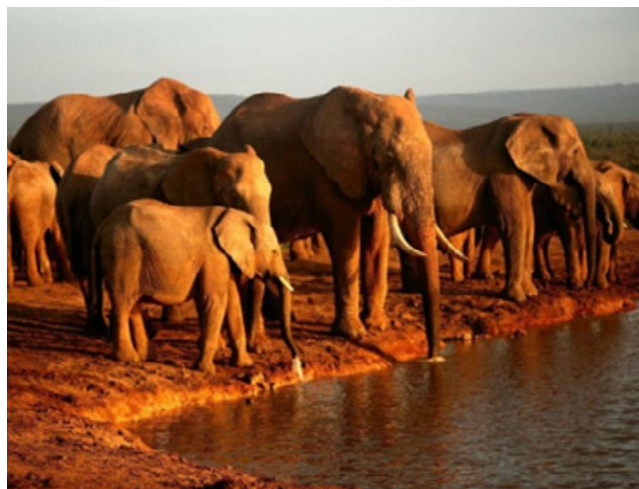
Figura 1: Manada de elefantes

Además, el exmandatario garantizó la supervivencia del partido, aumentando su influencia política principalmente en la opinión pública; esto se dio por medio del proceso de paz, debido a que el partido de la U fue uno de los líderes de esta propuesta y generando así que su impacto en la opinión pública a nivel nacional fuera cada vez mayor. Por otra parte, produjo que su influencia en los asuntos políticos fuera cada vez más grande. Por último, la actitud del partido durante este periodo fue despreocupada parecida a la de los elefantes, ya que tenían cubiertas la mayoría de sus necesidades políticas entre ellas: puestos estatales, contratos, influencia y poder político.