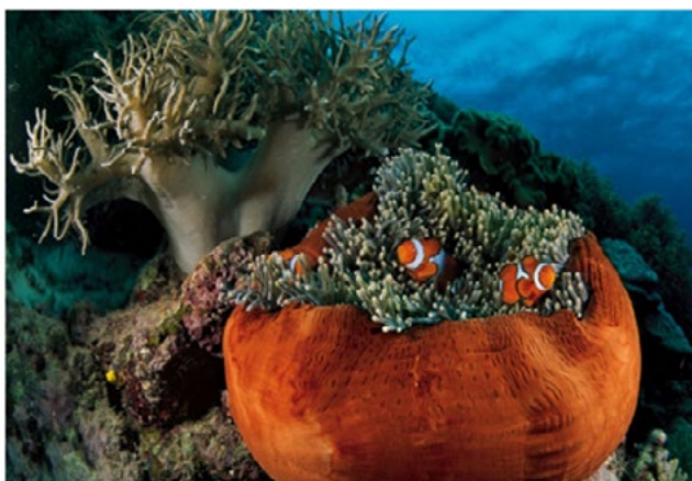
Figura 6: Pez payaso y la anémona