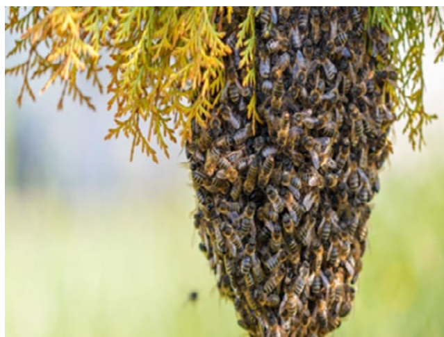
Figura 2: Enjambre de abejas