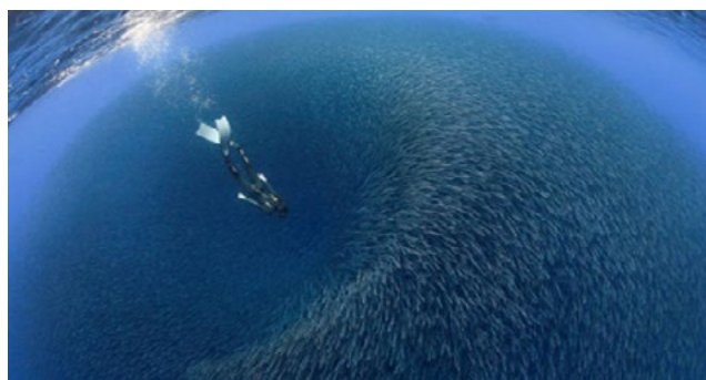
Figura 4: Cardumen de peces