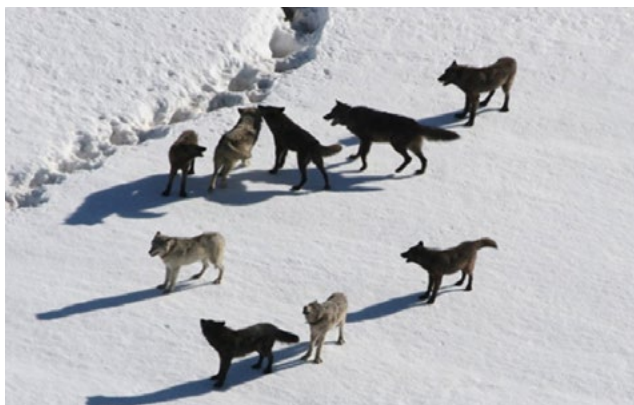
Figura 7: Jauría de lobos

puede seguir para que le brinde seguridad; tal como se evidencio en las elecciones del 2014 donde presentaron su propio candidato a la presidencia y no apoyaron la reelección, pero a pesar de esto obtuvieron participación en el gabinete del expresidente Santos y apoyaron el Proceso de Paz, el cual fue crucial.