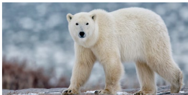
Figura 3: Oso polar

El Polo Democrático es un partido que comparte conductas con los osos polares, esto se evidenció durante el periodo 2014-2018; en el cual el partido mantuvo un comportamiento estable en sus acciones, sin importar quien estuviera en el poder es decir quién era el jefe de estado; por otra parte el Polo Democrático se ha caracterizado por mantenerse al margen construyendo una oposición de izquierda contra el gobierno, creando una imagen fuerte que le ha permitido sobrevivir en el sistema político sin necesidad de estar en una búsqueda constante de protección. Estas conductas se asocian con los osos polares que es fuerte, solitario, que sin importar los animales que lo rodean su comportamiento no se ve afectado y logran sobrevivir en ambientes difíciles sin necesidad de aliarse con otras especies.